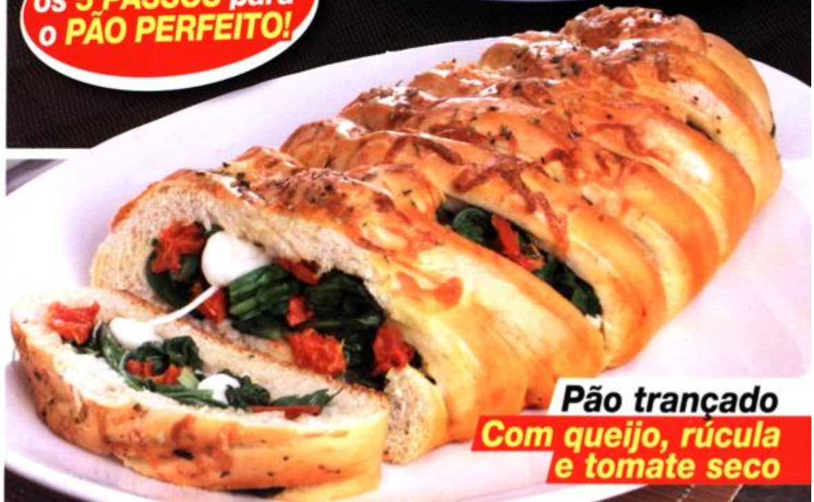
Pão trançado Com queijo, rúcula e tomate seco