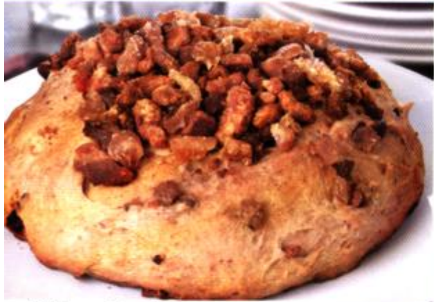
Pão de torresmo Rende 2 pães!

Edu ensina os 5 PASSOS para o PÃO PERFEITO!